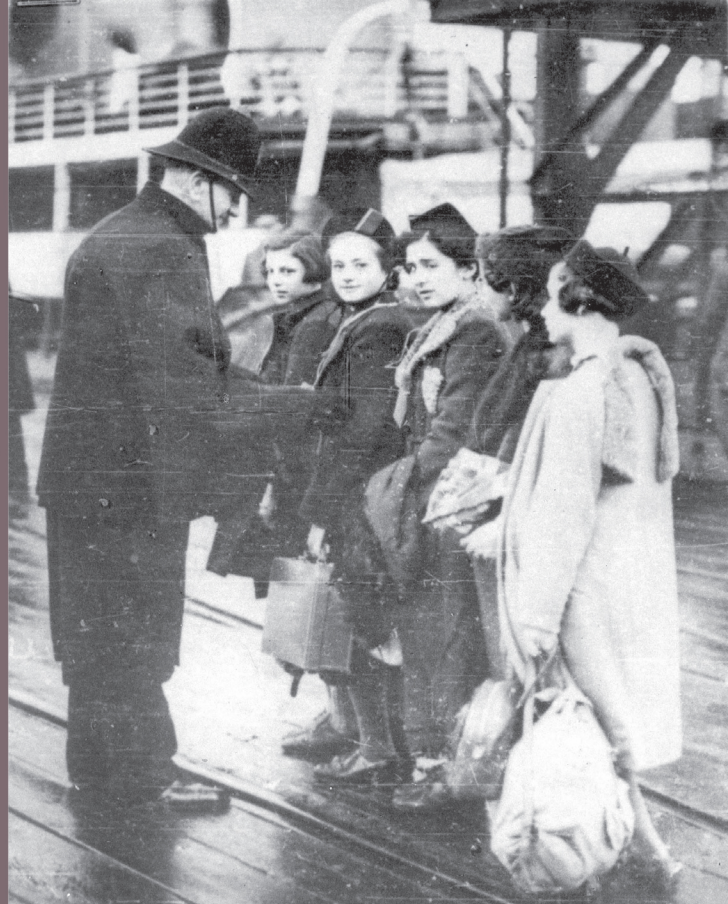
Bambini ebrei rifugiati arrivano a Londra, 13/12/1938